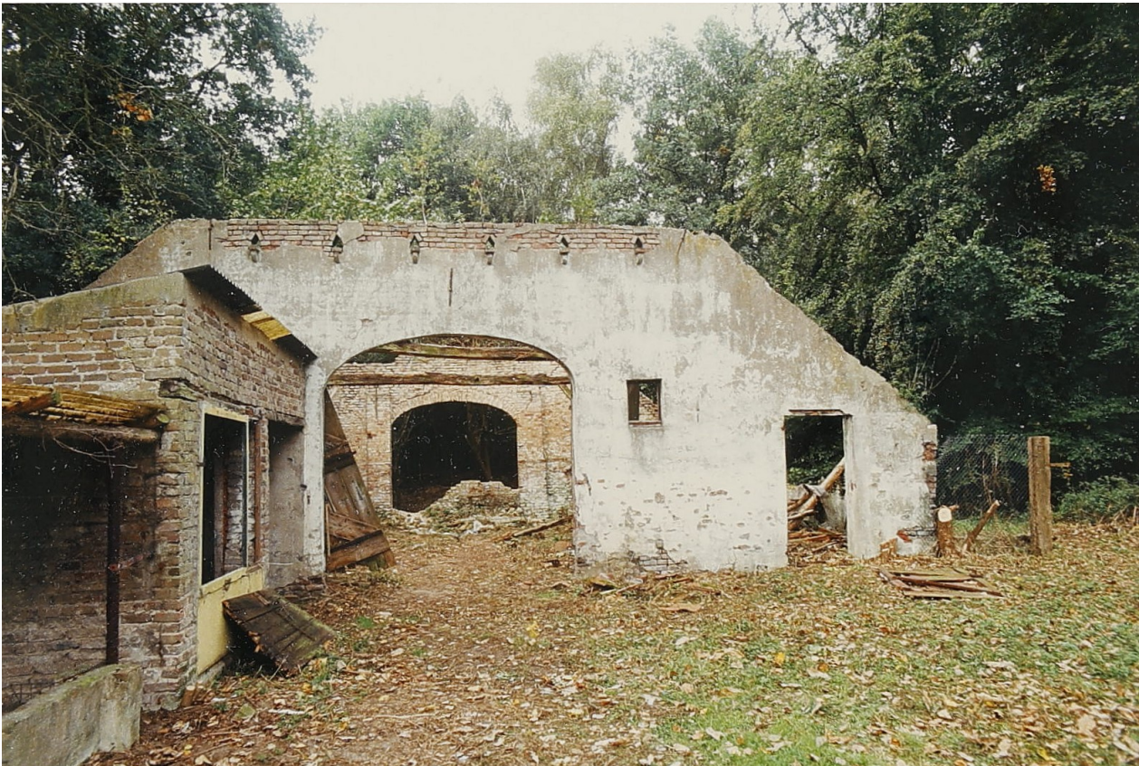
Abb. 4.: Die „Fruchtscheune“ kurz vor ihrem Abriss.

1985 wurde Duvendahl schließlich unter Denkmalschutz gestellt. 8 Das Schicksal des Hauses stand jedoch unter keinem guten Stern. Im selben Jahr wurde ebenfalls die „Verordnung über die Festsetzung von Wasserschutz-zonen für den Bereich der Stadt Emmerich“ wirksam. 9 Haus Duvendahl befand sich juristisch in einem Wasserschutzgebiet und die Nutzungsmöglichkeiten wurden stark eingeschränkt, ein durchgängiges Wohnen im Hause war scheinbar unmöglich geworden. Abzusehen war dies bereits 1978 gewesen, schließlich hatte die Stadt das Grundstück nicht aus historischem Interesse, sondern zur Flächensicherung für das Wasserwerk erworben. 10