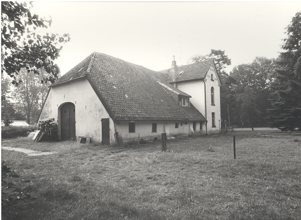
Abb. 1.: Haus Duvendahl 20 Jh.

Hiermit beantrage ich eine vorläufige Unterschutzstellung des von mir von der Stadt Emmerich gepachteten Hofes, Im Duvendahl 88.“ 1