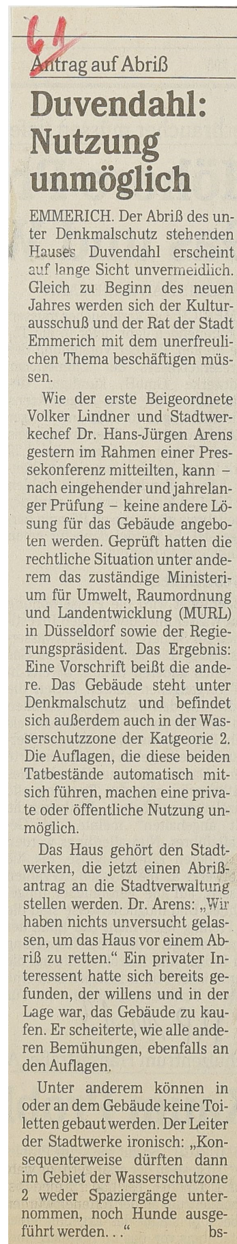
Abb. 6.: Artikel aus der NRZ anlässlich des Abbruchantrages.

Trotz des vehementen Einsatzes der LVR Denkmalbehörde und von zahlreichen Emmericher Bürgern, konnte das Gebäude nicht gerettet werden. Am 17.12.1990 stellten die Emmericher Stadtwerke einen Abbruchantrag. 17 Die zahlreichen Gutachten und Unterschriftensammlungen, konnten gegen die gesetzlichen Vorgaben nicht bestehen. Vor 30 Jahren erfolgte 1993 schließlich der Abriss. Emmerich verlor ein einzigartiges Gebäude. Es blieb nur ein Bodendenkmal zurück.