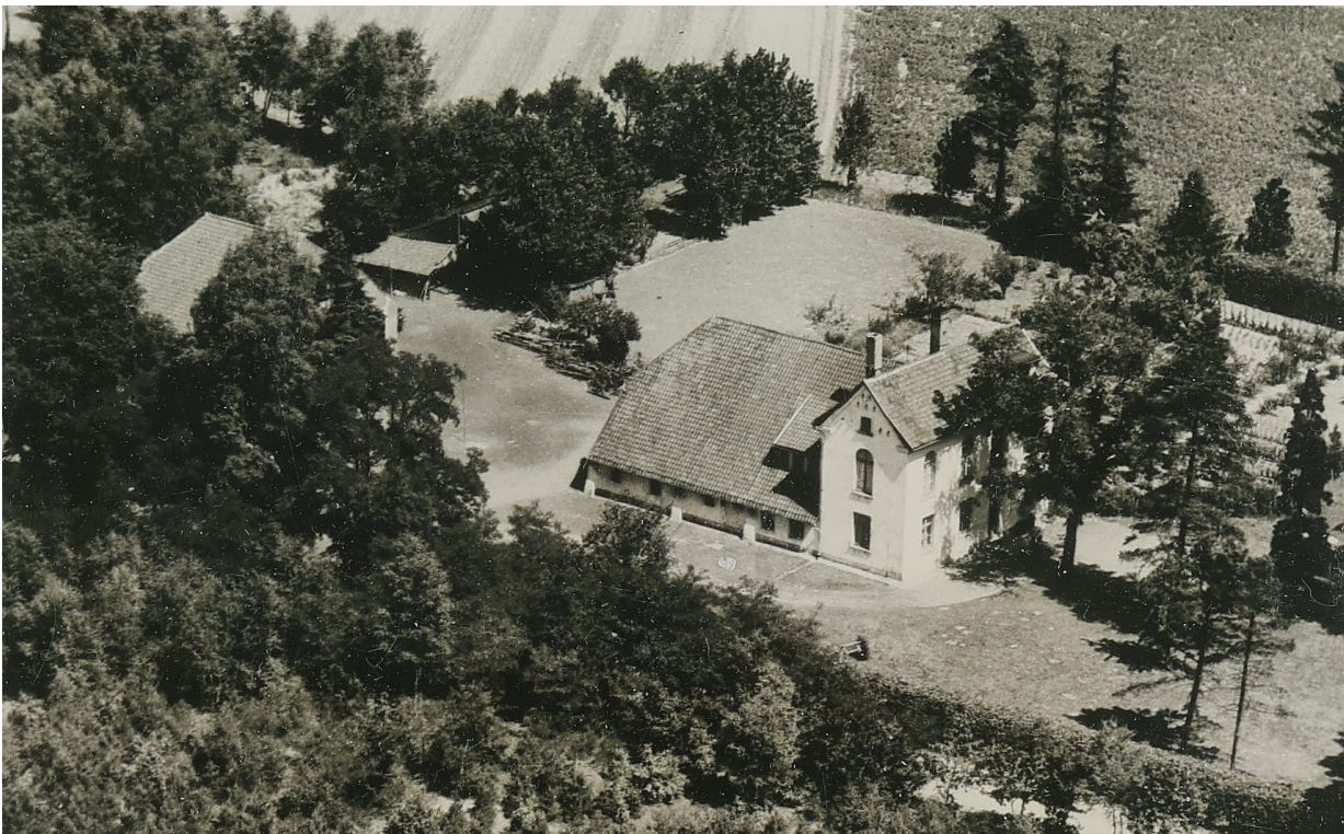
Abb. 2.: Haus Duvendahl ca. 1960.