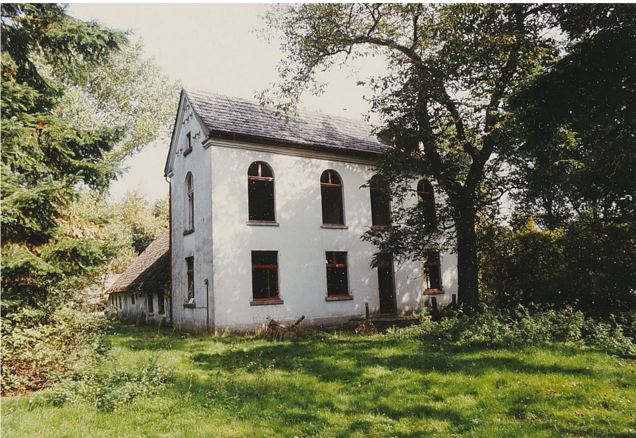
Abb. 5.: Duvendahl kurz vor dem Abriss.

Neben der Emmericher Bürgerschaft und dem LVR, suchte auch der aktuelle Mieter nach einer Lösung. Zwischenzeitlich bot er der Stadt sogar den Erwerb des Hauses und eine Kompensationszahlung für die Verlegung der Wasserbrunnen des Wasserwerks an. 14