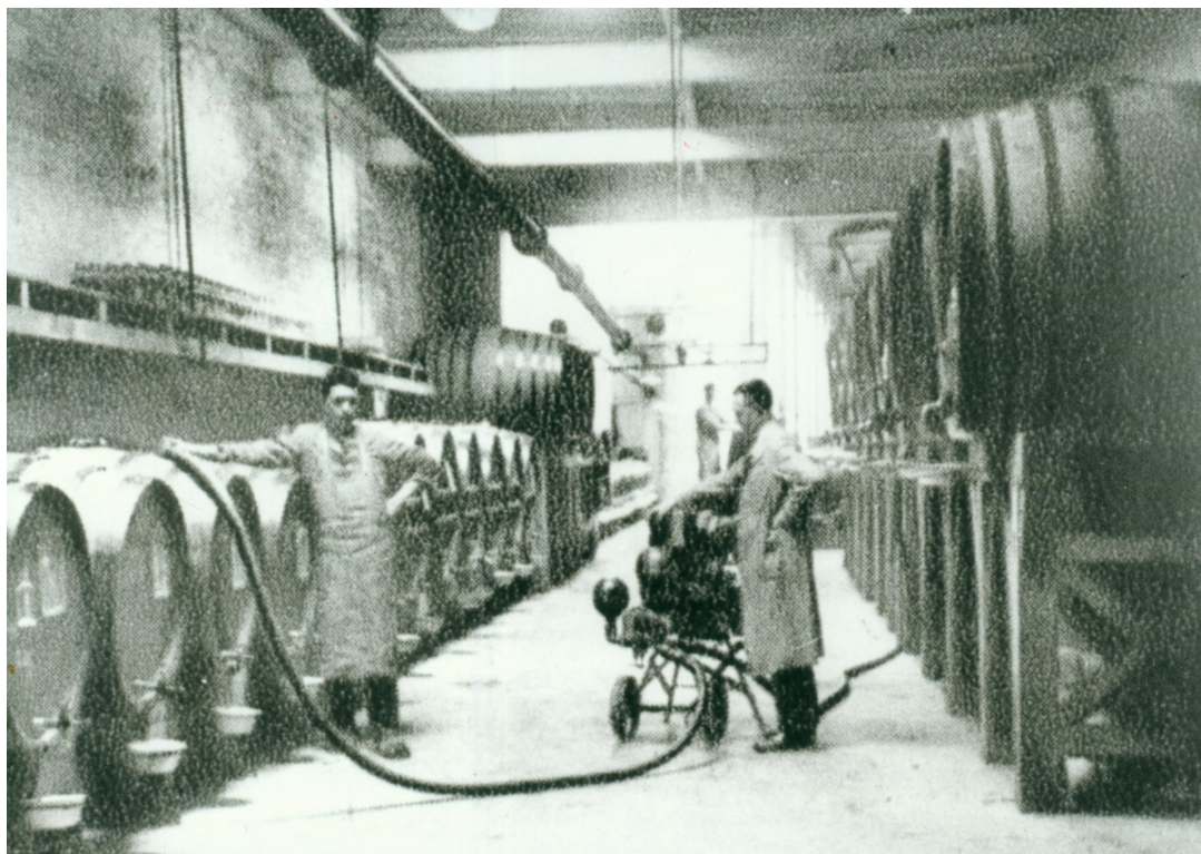
Abb. 2.: Fabrik Westhoven, ca. 1930er Jahre.