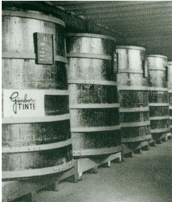
Abb. 3: Tintenfüßer, Tintenfabrik von Gimborn.