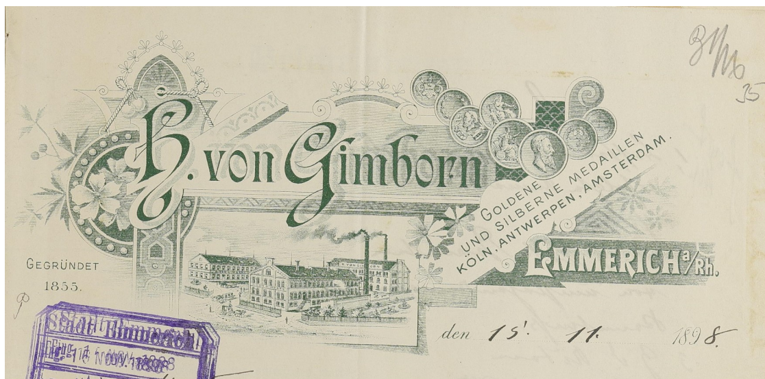
Abb. 1.: Briefkopf Fabrik H. von Gimborn, 1898.